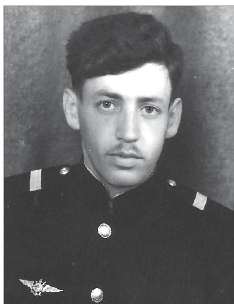
«И всё-таки мы победили!». Два возраста рядового героя великой войны