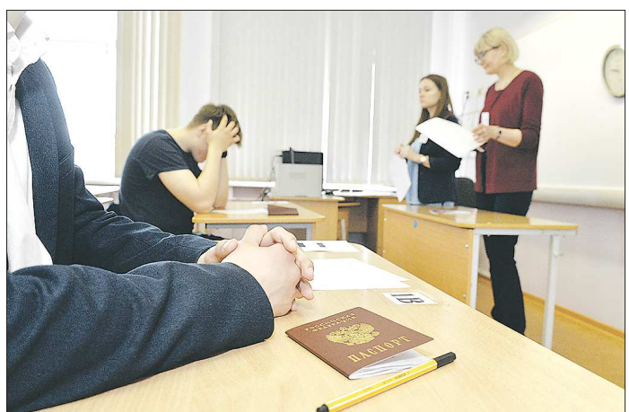
Экзамены в девятых классах начнутся уже в двадцатых числах мая