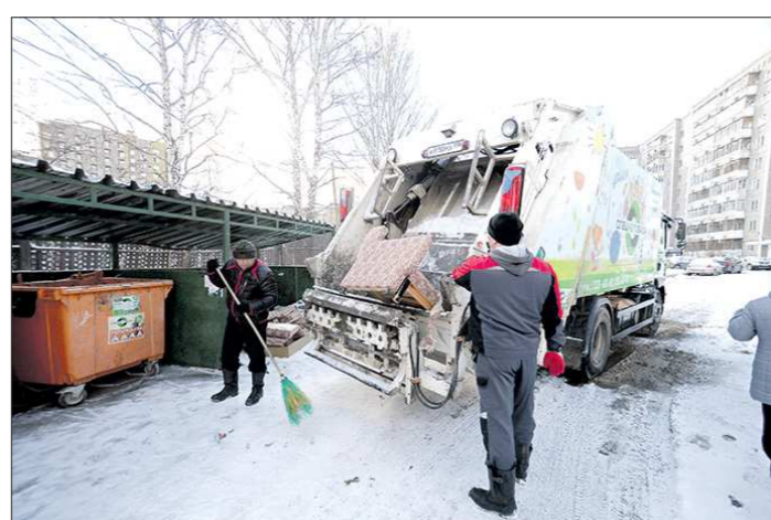
Через полминуты старый диван окажется внутри мусоровоза. Идеальный вариант, когда дворник УК или ТСЖ работает в связке с региональным оператором

Об экологической реформе граждане чаще всего вспоминают лишь тогда, когда видят переполненный мусорный контейнер. О том, что делается ежедневно, чтобы контейнерные площадки оставались чистыми, задумываться редко. Мы проследили путь мусорных мешков, которые выбрасывают жители Екатеринбурга, от контейнера до полигона.