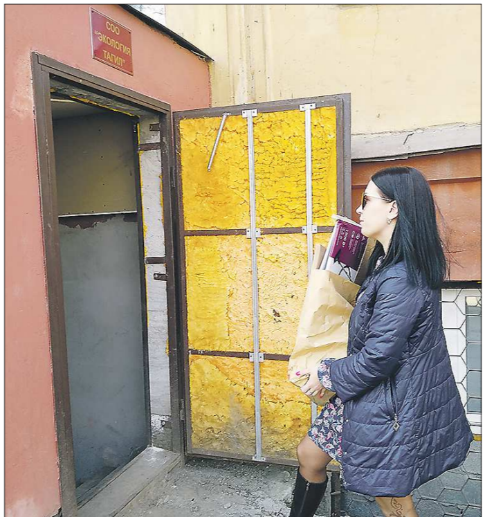
Макулатуру сдают и вполне успешные тагильчане – по идейным соображениям

Честно говоря, опыт у нашей страны есть. 12 лет назад по всей Москве были установлены две тысячи фандоматов, закупленных в Германии. Предполагалось, что горожане, опустив бутылку, смогут без проблем опустить