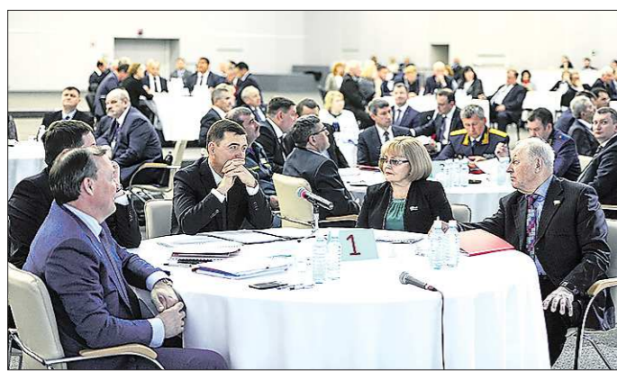
Евгений Куйвашев уверен: те проекты, которые реализует власть, должны прежде всего соответствовать запросам жителей региона