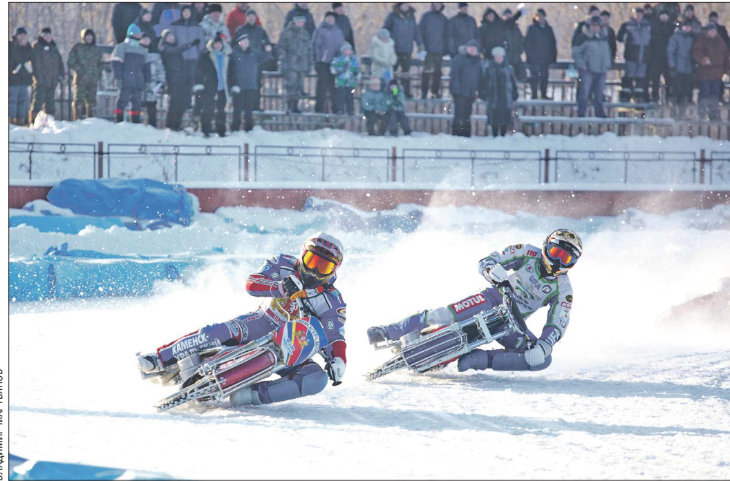
В начале января Каменск-Уральский принимал финал личного чемпионата России