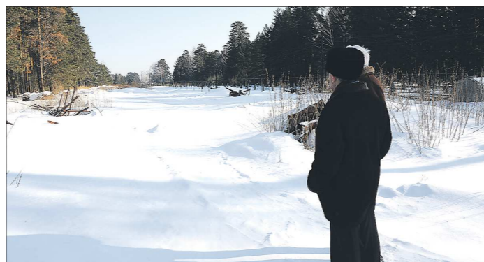
Семья, стоящая в очереди МУГИСО, может получить участок в любом муниципалитете, где они есть в наличии