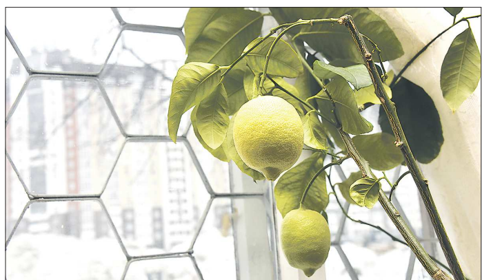
За окном ещё снег, а зрелый лимон напоминает о весне

– Они ароматнее магазинных из-за того, что южные плоды снимают недозрелыми. Пока фрукты везут, они теряют часть эфирных масел. А свои лимоны мы на корню доводим до потребительской спелости, само собой, они набирают максимум пользы и вкуса, – рассказывает старший научный сотрудник музея истории плодового садоводства Среднего Урала