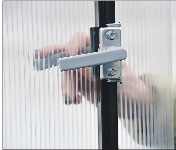
Качественно исполненные ручки могут многое сказать о производителе

В отличие от арочных, по бокам такой теплицы нет уменьшения высоты – значит, повсюду можно высаживать высокорослые растения. Стенки такой теплицы делают высотой 1,8 метра, а в коньке она может достигать 2,8 метра! В высокой теплице растения не так жарко, как в той же арочной. Но стоит она может как две простых арочных теплицы – 50 тысяч рублей и более.