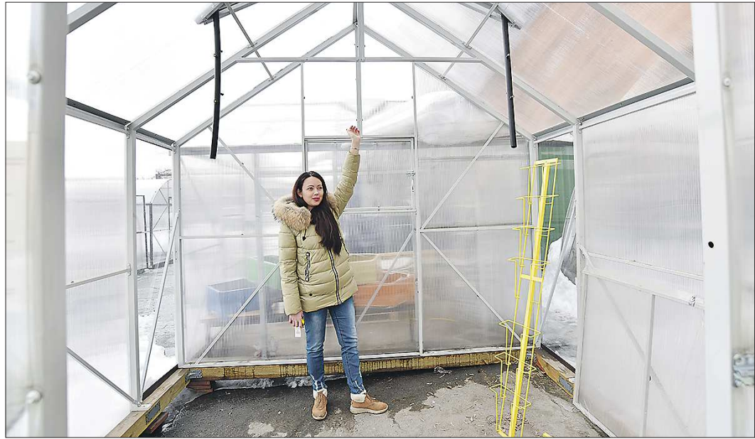
В теплице «домиком» до конька не дотянуться

Другой важный момент – усиление дуг арочной теплицы. Здорово, если есть сверху поперечина, которая как бы стягивает дугу. Ещё луч-