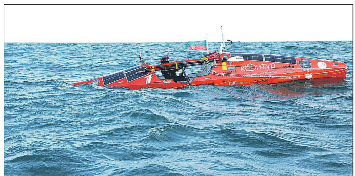
К Конохову подходит первый осенний шторм с ветром 80 километров в час