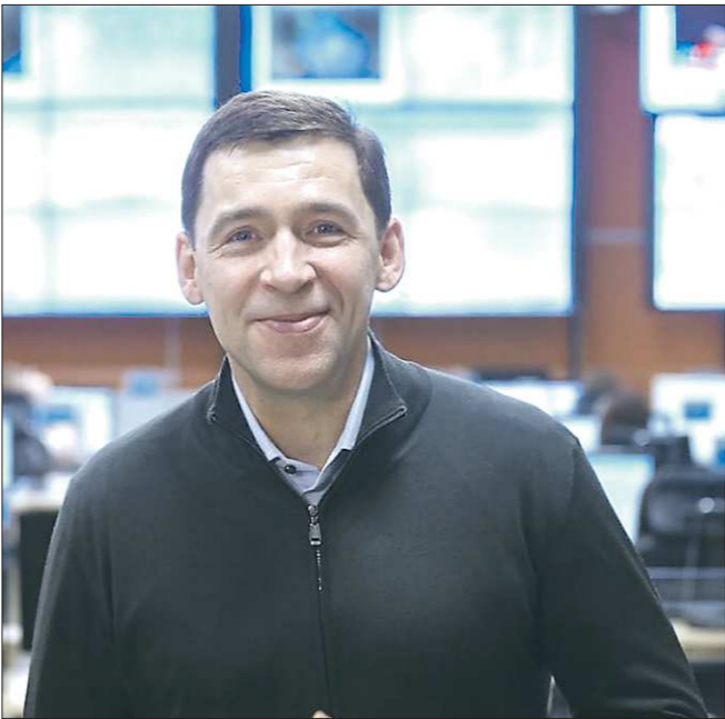
Всех перечисливших деньги в благотворительные фонды губернатор поблагодарил в своём Instagram

Губернатору Свердловской области Евгению Куйвашеву удалось собрать 8,81 млн рублей в качестве пожертвований для благотворительных фондов в честь своего дня рождения.