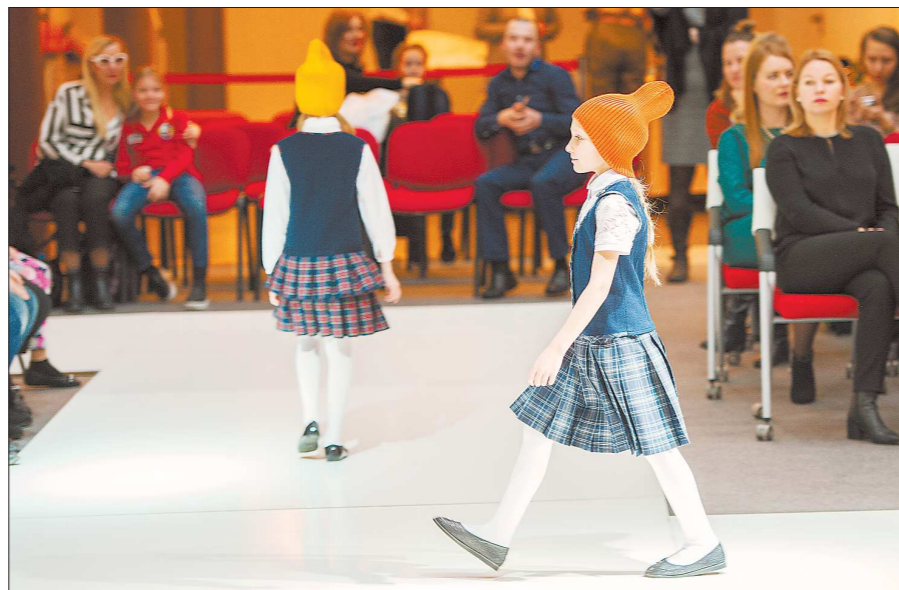
Фишкой показа одежды одной из уральских фирм стал выход в ярких шапках модного сегодня фасона. От этого все маленькие модели походили на гномиков

– Всегда большая проблема для производителя детской одежды – сертификация тканей. Материалы для школьной формы должны быть натуральными и иметь определённое соотношение хлопчатобумажного волокна и вискозы, поэтому многим тканям из Китая не удаётся пройти процесс сертификации в России. Наши же местные производители изготавливают одежду для школьников по требующимся стандартам и удобно для наших детей лекалу, –