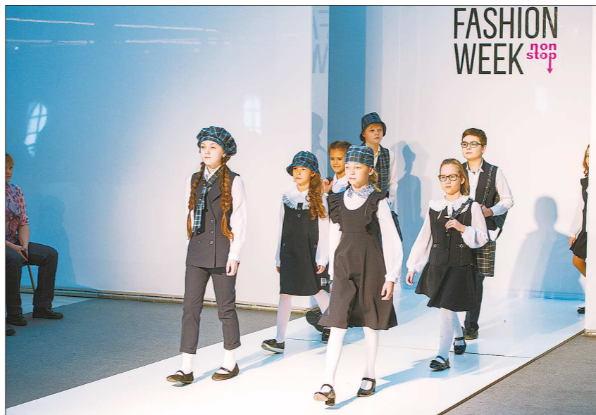
По мнению экспертов, ребята, которых причисли к деловому стилю в детстве, легко переносят его во взрослую жизнь