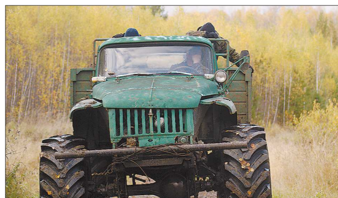
Этот мощный автомобиль-вездеход «Урал» специально оборудован для браконьерской охоты в труднодоступных местах