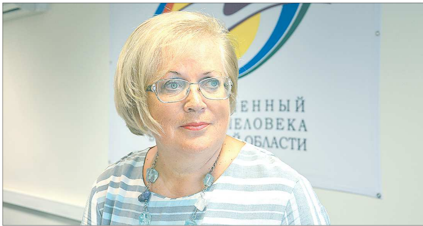
Уполномоченный по правам человека в Свердловской области Татьяна Мерзлякова

Т.Н. Москалькова обратила особое внимание участников дискуссии на то, что нормы Конституции, в том числе закрепляющие основные права человека и гражданина, являются нормами прямого действия. Но нужно констатировать и другой факт: к сожалению, сложившаяся практика такова, что государственные органы применяют Конституцию преимущественно опосредованным образом, через конкретизирующие её отраслевые органы. Это нередко порождает разрыв между конституционной нормой и практикой её воплощения в жизнь. Данный вывод