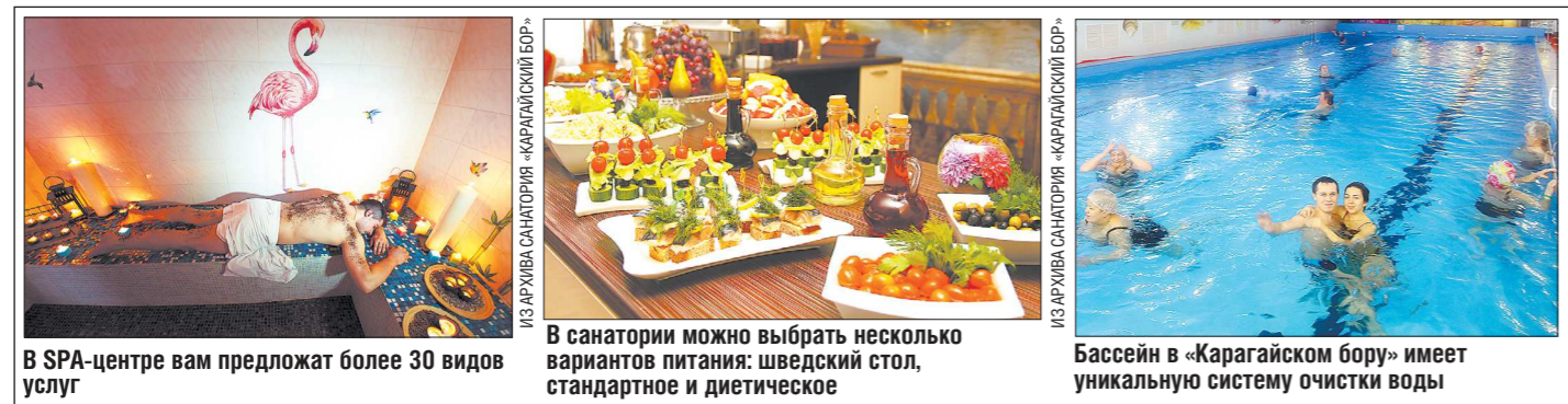
В SPA-центре вам предлагают более 30 видов услуг

— Рак молочной железы находится на первом месте по частоте онкологии у женщин, и, к сожалению, заболеваемость растёт. Сегодня мы выявляем примерно 60 процентов злокачественных новообразований молочной железы на I и II стадиях, но запущенных случаев по-прежнему много, — рассказал «Облгазе-