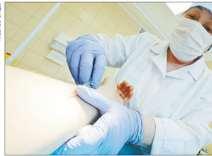
Увеличение места пробы Манту измеряется линейкой спустя трое суток после инъекции. До этого времени врачи настоятельно рекомендуют не терять «пуговку» на руке и по возможности не мочить её