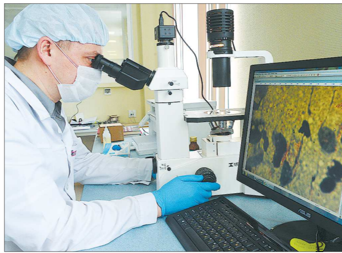
На современном оборудовании в отделении диагностики Свердловского областного противотуберкулёзного диспансера легко и быстро выявляют наличие палочки Коха в организме пациента