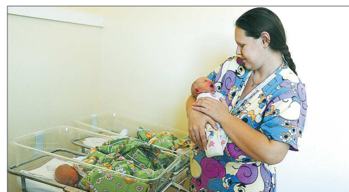
Большая часть медицинских мероприятий в регионе запланирована для сохранения возможности женщин стать мамами

Например, скоро в регионе начнёт расширяться действие апробированный в прошлом году в Первоуральске профилактический проект «Мама, не кури!». Основная цель — мотивировать женщин репродуктивного возраста на отказ от курения, негативно сказывающегося на здоровье всего организма. Что касается информирования о вреде алкоголя и наркотических и пси-