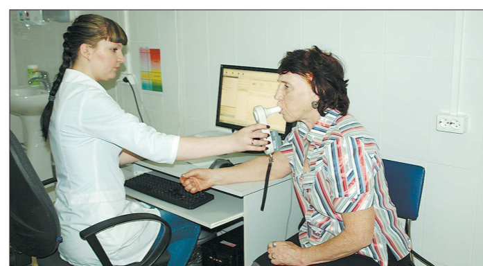
На профилактических осмотрах у женщин проверяют содержание глюкозы и холестерина в крови, объём лёгких и состояние сердца