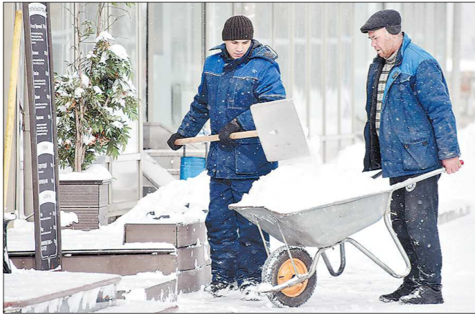
Если центр Екатеринбурга коммунальщики почистили относительно быстро, то на окраинах города жителям самостоятельно пришлось решать проблемы, связанные со снегопадом, например, вытаскивать забуксовавший автобус