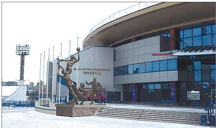
Эскиз скульптурной композиции, размещённый на официальном портале Екатеринбурга

На официальном портале Екатеринбурга проводится опрос на тему размещения скульптурной композиции, посвящённой волейбольной команде «Уралочка» возле одноимённого Дворца игровых видов спорта на Олимпийской набережной. К 15 часам среды подано 210 голосов (в том числе корреспондентом «Областной газеты»).