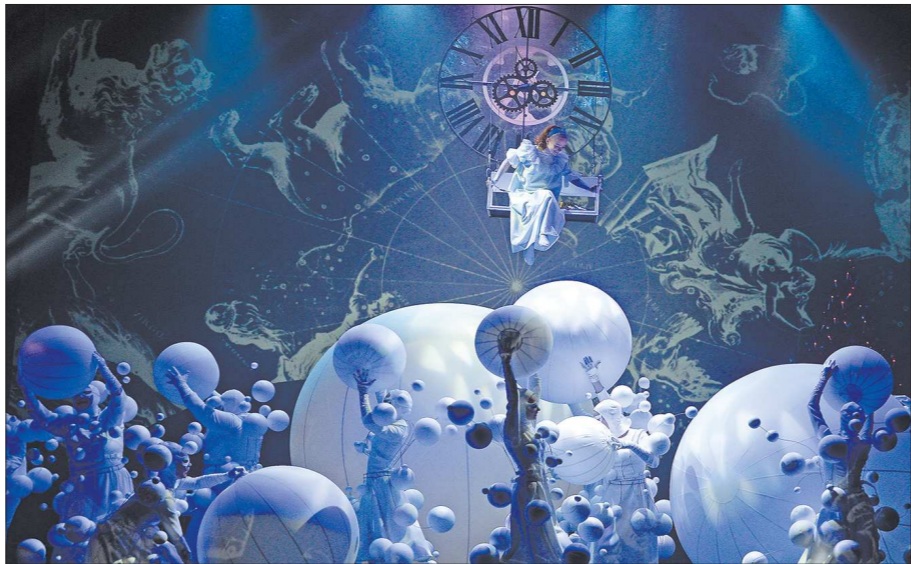
То ли во сне, то ли наяву Мари Штальбаум, оказавшись в королевстве Щелкунчика, витает в зефирных облаках

Но от Максима как от победителя национально-го чемпионата ждали побед на международных стартах уже сейчас, с этой ответственностью он, увы, справиться не смог. Не будем загадывать, но хочется, чтобы большое возвращение фигуриста продолжилось в следующем сезоне.