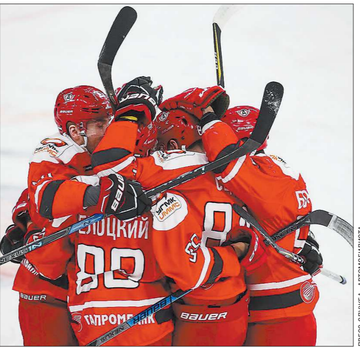
«Авто» пробился во второй раунд плей-офф Кубка Харламова

«Авто» одержало победу со счётом 3:0 в матче, 3:1 в серии и вышел в 1/4 финала Кубка Харламова.