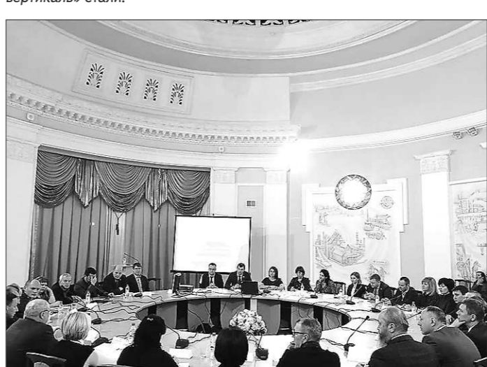
14 декабря, г. Нижний Тагил

14 декабря активными участниками круглого стола «Эффективность правового регулирования предпринимательской деятельности в реальном секторе экономики Свердловской области» в рамках реализуемых проектов Свердловского регионального объединения «Депутатская вертикаль» стали: