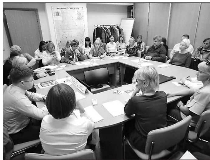
«Открытые классы» 31 мая и 19 июня г. Екатеринбург