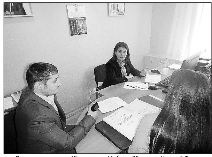
Выездные приемы 13 апреля, г. Ирбит и 25 мая, г. Нижний Тагил

Для повышения уровня правовых знаний общественных помощников, обмена опытом и совершенствования взаимодействия с Аппаратом Уполномоченного проводится обучение общественных помощников. 26 февраля был проведен семинар-совещание, участие в котором приняли 10 общественных помощников из 9 муниципальных образований Свердловской области.