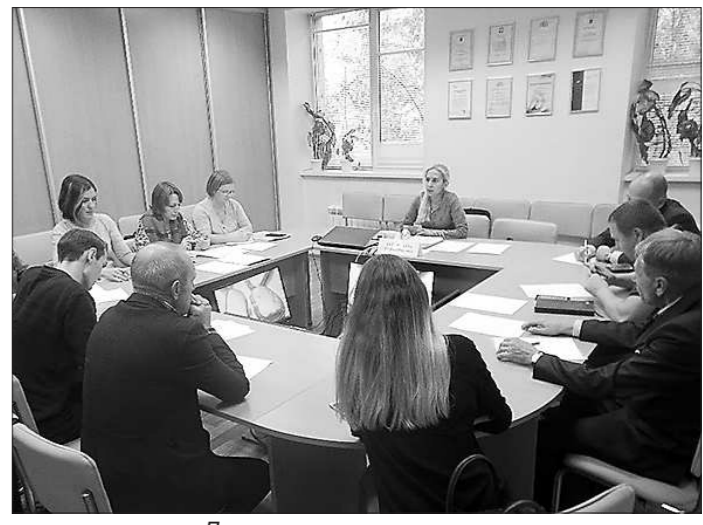
(Продолжение на 3-й стр.)