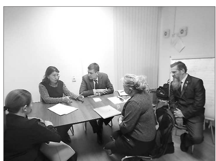
Выездные приемы 26 января, г. Полевской и 27 февраля, г. Заречный