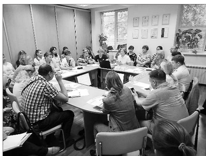
«Открытые классы» 27 июня г. Красноуральск и 12 июля г. Екатеринбург