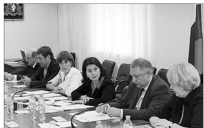
Заседание Совета при Уполномоченном (28 августа, г. Екатеринбург)

На заседании Совета 28 августа до участников была доведена информация о результатах деятельности созданных при Уполномоченном и Совете трех рабочих групп по отдельным системным проблемам. Члены Совета одобрили практику такого формата работы как важную и эффективную, способствующую последовательной, системной проработке отраслевых предложений по совершенствованию регулирования отдельных сфер предпринимательской деятельности с участием экспертов и бизнеса.