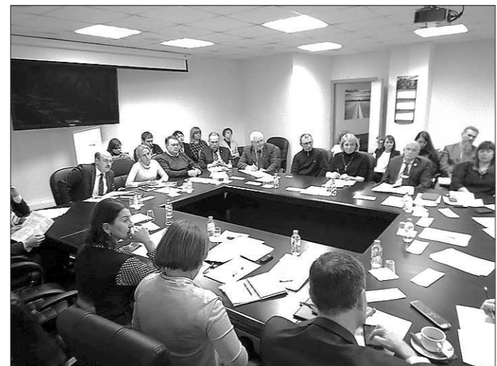
Расширенное заседание Совета при Уполномоченном (25 января, г. Екатеринбург)

налоговой сфере, в деятельности правоохранительных, следственных органов, контрольно-надзорных органов.