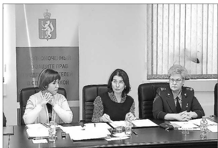
Заседание Совета при Уполномоченном (25 января, г. Екатеринбург)

Общественный экспертный совет при Уполномоченном (далее — Совет, Совет при Уполномоченном) является совещательным, консультативным органом. Главная задача Совета — формирование общественной и экспертной позиции по вопросам, возникающим в деятельности бизнес-омбудсмена, обеспечение его взаимодействия с предпринимательским, экспертным, научным и правозащитным сообществом, общественными объединениями предпринимателей, органами публичной власти в целях более полного учета общественных потребностей и повышения эффективности деятельности. Совет более чем на половину состоит из руководителей бизнес-объединений, в том числе отраслевых, и представителей экспертного, научного сообществ. С учетом опыта работы Совета в предыдущие годы и специфики рассматриваемых вопросов, был актуализирован его состав. Обновленный состав утвержден приказами Уполномоченного по защите прав предпринимателей в Свердловской области от 29.06.2018 № 15 РУП, от 16.08.2018 № 20 РУП. Проведено три заседания Совета, в ходе которых обсуждались актуальные затруднения в предпринимательской деятельности, исходя из выявленных в ходе работы системных проблем. Информация о деятельности, протоколы заседаний Совета размещены на официальном сайте Уполномоченного в информационно-телекоммуникационной сети «Интернет» (далее — сайт, сайт Уполномоченного) в разделе «Общественный экспертный совет» по ссылке: https://uzpp.midural.ru/article/show/id/136 .