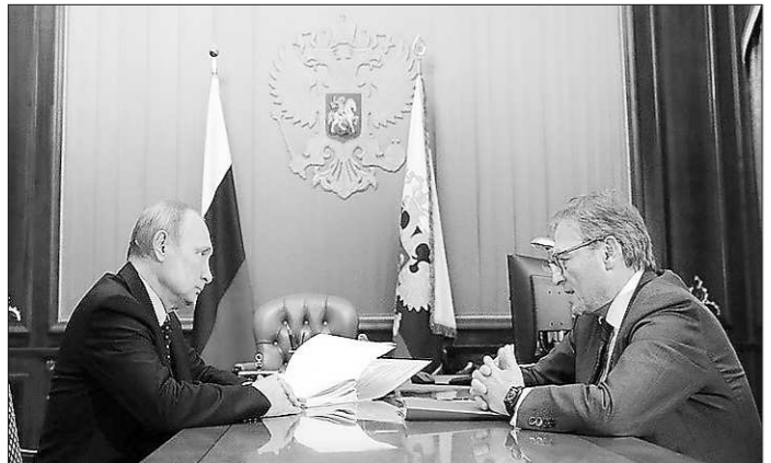
Губернатор Свердловской области Е.В. Куйвашев и Уполномоченный Е.Н. Артох на встрече с представителями и руководителями субъектов малого и среднего бизнеса (30 августа, г. Екатеринбург, Резиденция Губернатора Свердловской области)

Предельный объем финансирования из областного бюджета составил 17 908,3 тыс. рублей, кассовое исполнение бюджета Аппаратом Уполномоченного — 17 904,7 тыс. рублей (99,98 процента от бюджетных ассигнований), в том числе: ФОТ с начислениями — 16 173,4 тыс. рублей, в том числе: — 12 679,4 тыс. рублей — заработная плата, — 3 494 тыс. рублей — начисления на ФОТ. Внешними проверками Счетной палаты Свердловской области, проведенными по итогам годовой бюджетной отчетности Аппарата Уполномоченного за 2014 — 2017 годы, нарушений не выявлено.