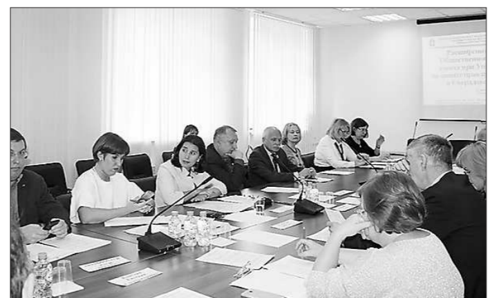
Расширенное заседание Совета при Уполномоченном (21 мая, г. Екатеринбург)

На расширенном заседании 21 мая, в рамках ежегодной общественной Уполномоченным тематической недели «Право на бизнес», посвященной профессиональному празднику Дню российского предпринимательства, обсуждались вопросы: — о предложениях от Свердловской области в Ежегодный доклад Президенту Российской Федерации по итогам деятельности института Уполномоченного при Президенте Российской Федерации по защите прав предпринимателей в 2018 году; — об апробации проверочных листов, используемых при проведении плановых проверок в отношении объектов общественного питания;