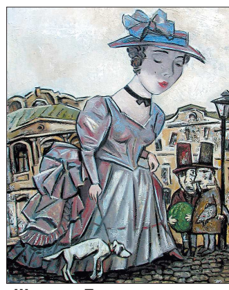
«Штучка». По мотивам романа М. Салтыкова-Щедрина «Современная идиллия». 2016. Оргалит, масло