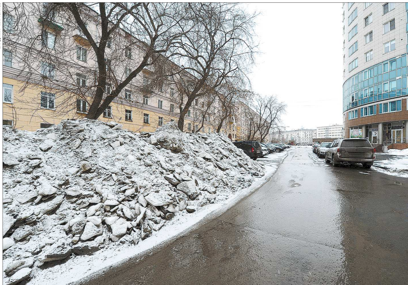
В причинах такого «заговора» ещё предстоит разобраться, а пока на улицах Екатеринбурга растут грязные снежные кучи. И дело тут не в районе: подобные горы можно увидеть и на окраинах, и в центре города