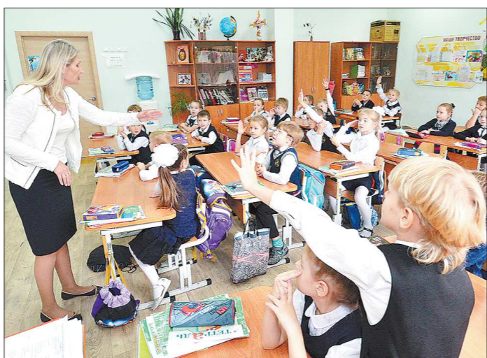
В новом пенсионном законодательстве, как и прежде, учитывается тяжёлый труд педагогов. Льготный стаж для учителей составил 25 лет

Другая категория предпенсионеров, имеющих право на переобучение по этой программе, — это те, кто находится в поисках работы. Не надо путать их с безработными, стоящими на учёте в центрах занятости.