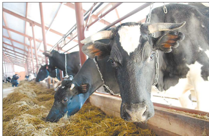
Сейчас на ферме 350 коров, в ближайшее время появится ещё 50

В верхотурском селе Кордюково появилось новое «градобразующее» предприятие. Вчера первый замгубернатора Алексей Орлов принял участие в торжественном пуске новой фермы, рассчитанной на 400 голов дойного стада. Проект стоимостью 57 млн рублей софинансирован из областного бюджета. На его реализацию было выделено порядка 19 млн рублей, срок окупаемости – 8 лет.