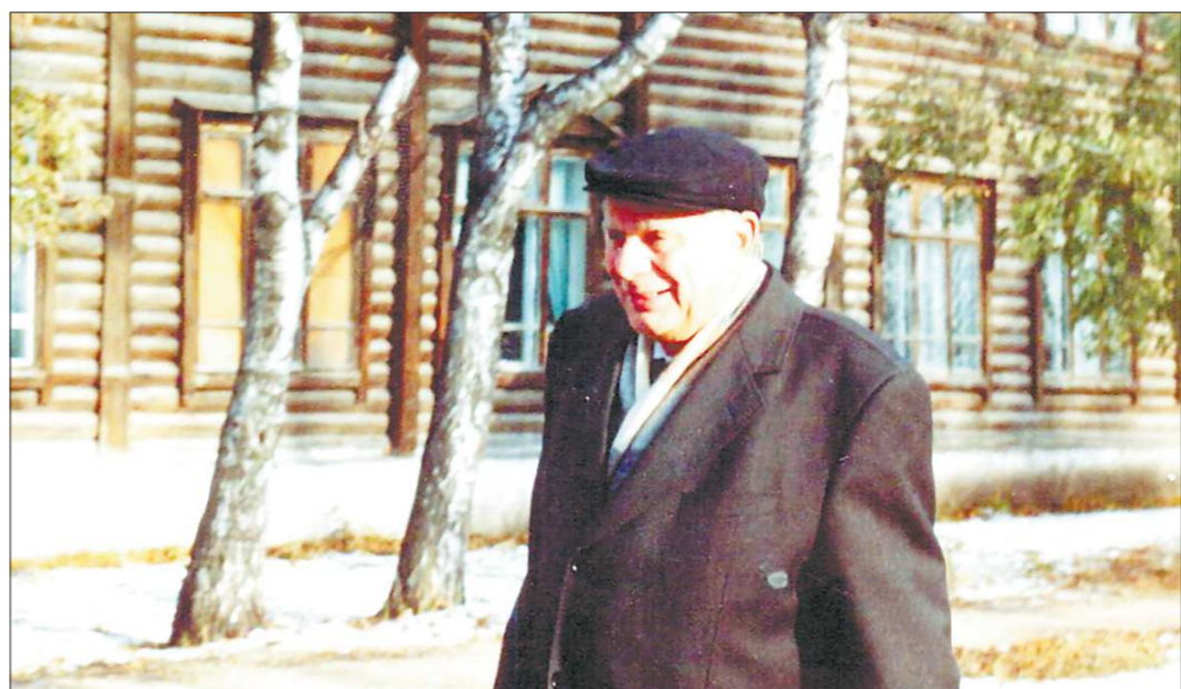
Жорес Алфёров у стен родной школы в Туринске

На 89-м году жизни скончался лауреат Нобелевской премии по физике, академик Жорес Алфёров. Учёный с мировым именем, лауреат множества премий, в том числе и нашей Демидовской за 1999 год, Бессмертный депутат Государственной думы с 1995 года. Но мало кто знает, что в жизни этого выдающегося учёного была и уральская страничка.