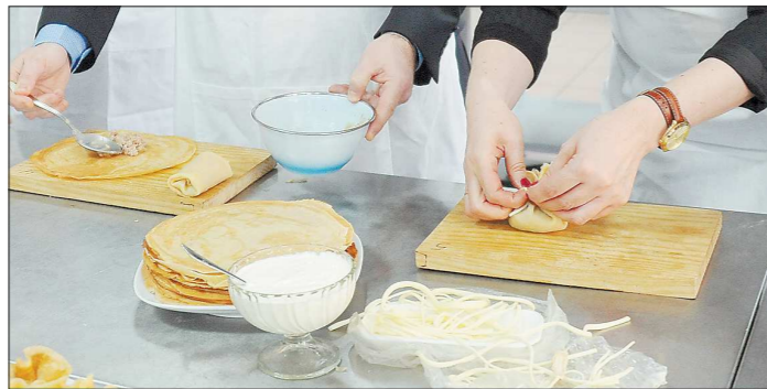
Блины на Масленицу до сих пор пекут по простому и очень древнему рецепту: вода, мука, яйцо и масло

В России начали отмечать один из древнейших и веселых праздников – Масленицу. Её дата ежегодно меняется в зависимости от времени празднования Пасхи, и в этом году выпала на 4–10 марта. И хоть традиции масленичных гуляний меняются со временем, они по-прежнему объединяют многие народы России и Среднего Урала.