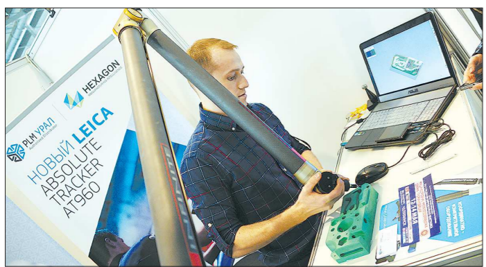
Заминка произошла только с финансированием научно-технических проектов