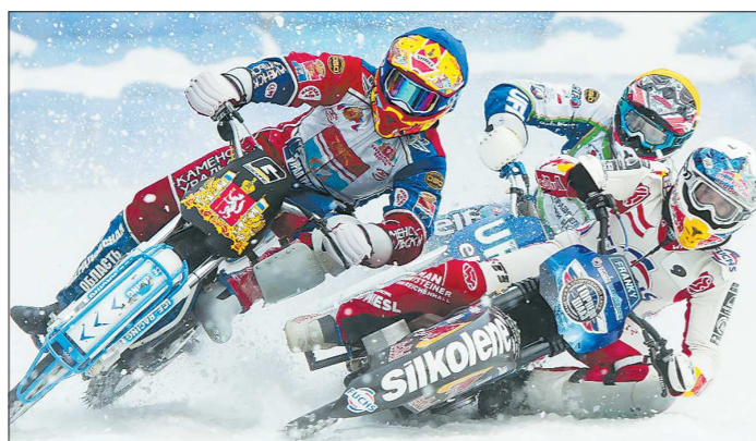
Победитель в ледовом спидвее зачастую определяется на самом последнем повороте

Рокочными для каменских «ледовых гладиаторов» ста-