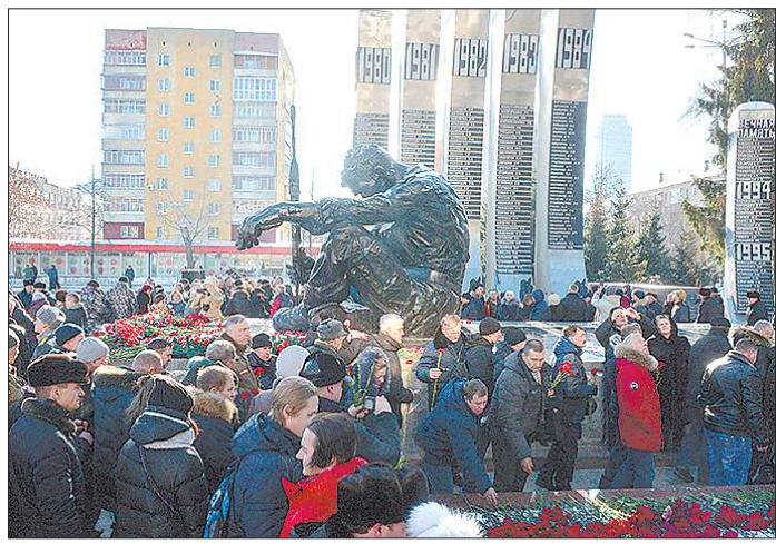
В боевых действиях в Афганистане участвовало порядка восьми тысяч свердловчан, 242 из них погибли