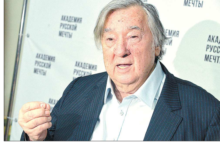
В качестве корреспондента «Литературной газеты» Александр Проханов был в Афганистане, Никарагуа, Камбодже, Анголе

Александр ПРОХАНОВ – известный собеседник. Иногда он эпатижен, парадоксален, и иной раз хочется с ним поспорить, но он всегда интересен своими знаниями и суждениями о ситуации в мире и месте России в нём, истории и проблемах своей страны.