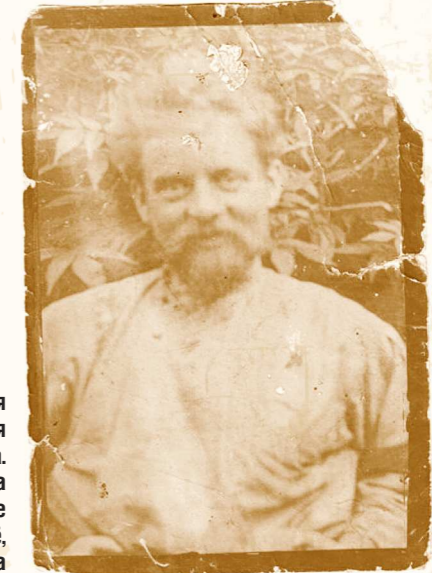
Самая старая фотография бородатого Бажова. У Павла Петровича здесь даже не борода ещё, а бородка

Во вчерашнем номере мы сообщили, что Павел Петрович Бажов свою знаменитую бороду отпустил в период преподавания в Екатеринбургском духовном училище – между 1899 и 1907 годами. Сегодня мы можем сузить рамки этого события.