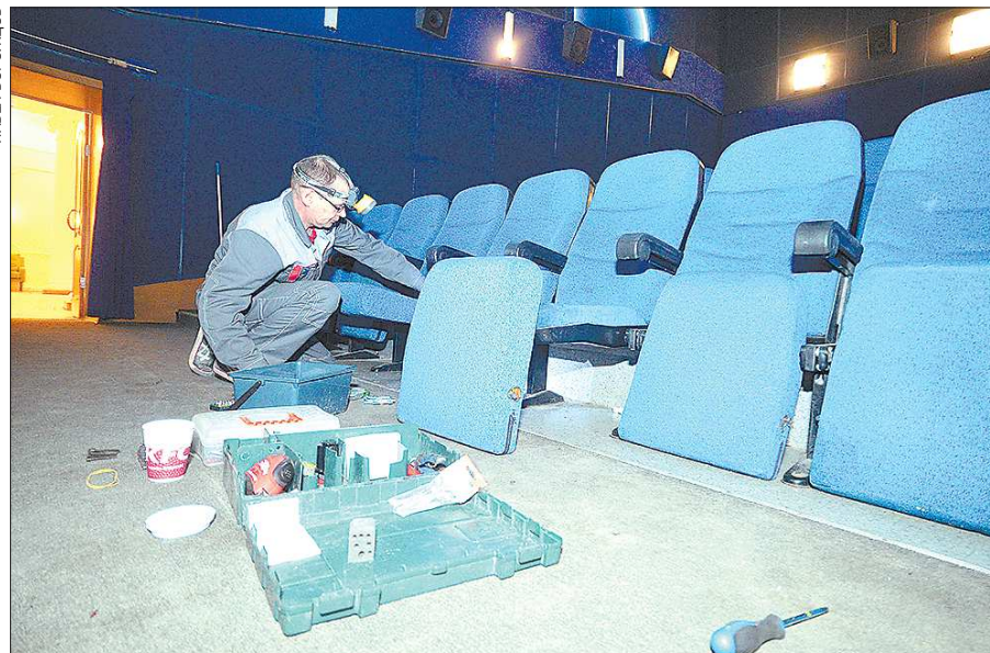
Пока здание закрыто от посетителей, в нём ведутся работы, например, проводится ремонт кресел в кинозале