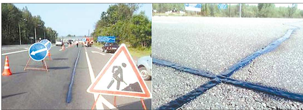
Битумно-полимерная лента, предназначенная для санации трещин асфальтобетонного покрытия