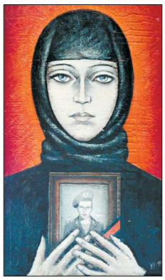
«Память», Сергей Карякин

Войне посвящена часть работ этой экспозиции, в остальных произведениях авторы представили свои размышления о мирном сосуществовании.