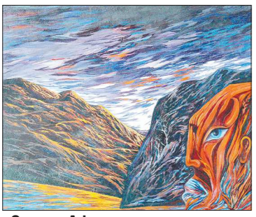
«Страна Афганистан», Александр Елизаров

Сегодня в Екатеринбургской галерее современно-го искусства открывается выставка произведений художников-ветеранов «Творчество, рождённое войной».