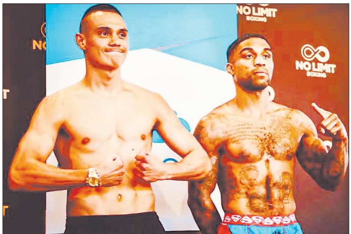
Тим Цзю не испытал страха перед более опытным соперником и довёл дело до победного конца уже во втором раунде

Впрочем, тех, кто пристально следит за боксом, новость о том, что сын идёт по стопам отца — вряд ли удивила.