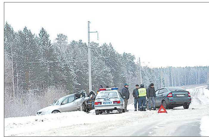
Если у водителя-виновника аварии нет полиса ОСАГО, ремонтировать ему придётся обе машины за свой счёт

В принципе Минфин и Центробанк ещё в 2017 году предприняли ряд нововведений в ходе реформы ОСАГО, и шаги, которые сделаны в нынешнем году - не последние. В частности, планируется увеличить тарифный коридор сначала до 30, а потом и до 40 процентов. Кроме того, у нас в области появился финансовый омбудсмен, который и будет с 1 июля этого года «разруливать» споры и конфликты на рынке автострахования. Вроде бы в Европе и