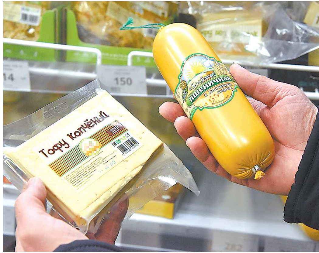
Соевый сыр, пшеничная колбаса... Но сыр по определению молочный продукт, так же как колбаса - мясной

Такое наступление на молоко чревато негативными последствиями для здоровья людей.