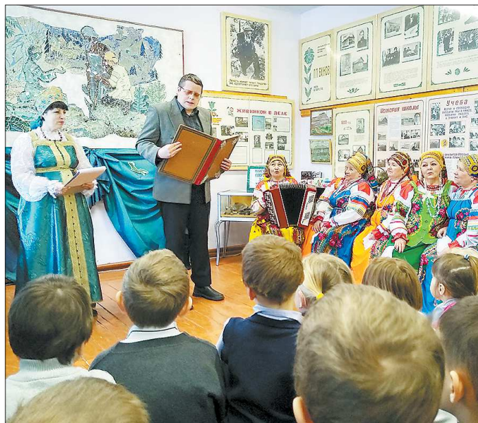
Одно из праздничных мероприятий прошло в Шайдурхе. Гости праздника читали сказы Бажова, связанные с невяньской землёй

Невяньскую падающую башню необходимо сохранить как памятник истории и архитектуры, взять его под охрану государства как символ величия, умения и трудолюбия рабочего человека уральской земли, из жизни которого я и составил свою книгу сказов «Малахитовая шкатулка», – убеждал вождя Павел Бажов.