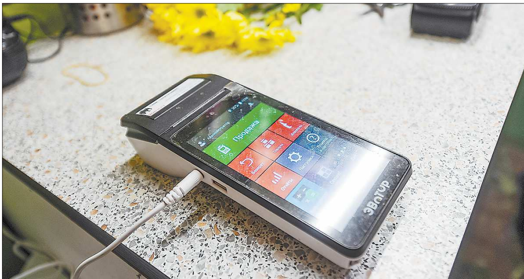
Для некоторых категорий предпринимателей устанавливаются новые сроки обязательного использования ККТ — 1 июля 2019 года

Для многих предпринимателей новые правила стали неприятной неожиданностью. Одной из основных проблем, с которой столкнулись предприниматели, стало то, что у многих не хватало денег на закупку аппаратов. Как ранее писала «Областная газета», в 2017 году предприниматели нашего региона даже обращались в Госдуму с просьбой предусмотреть в бюджете средства на компенсацию затрат на покупку новых аппаратов – решение, кстати, было принято на Общественном экспертном совете при уполномоченном по защите прав предпринимателей.