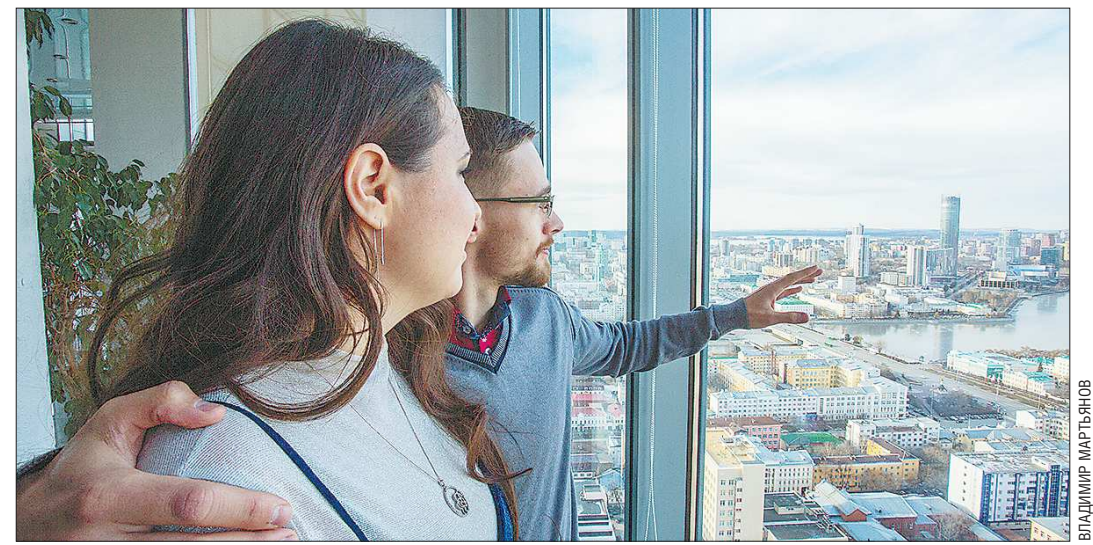
Жители смогут познакомиться со стратегиями своих районов до конца этого года