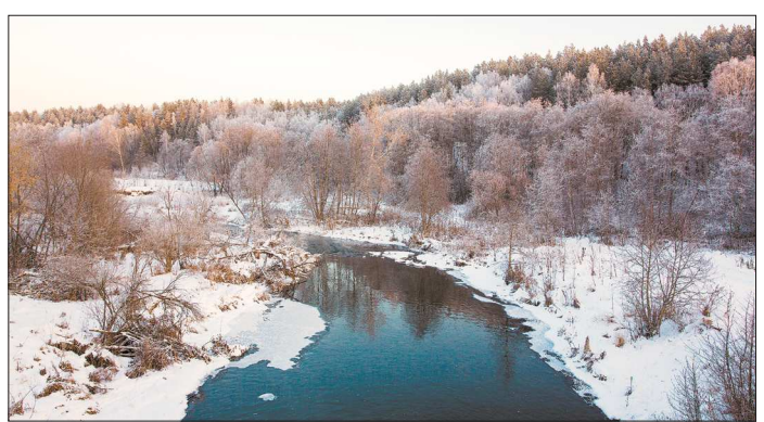
В ближайшие пять лет природный парк «Река Чусовая» должен стать туристским центром европейского уровня