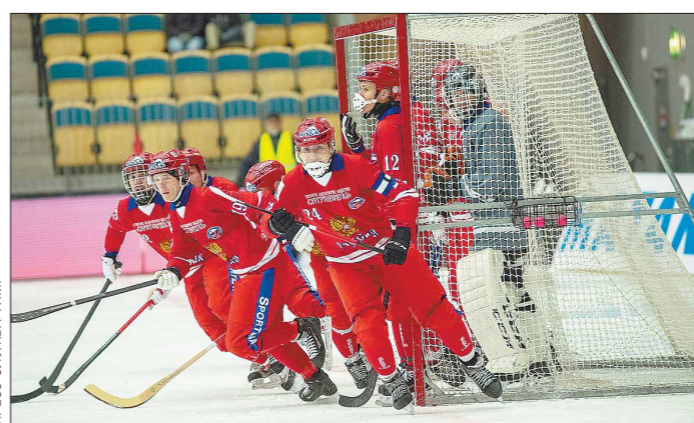
Два мяча из шести сборная России пропустила после розыгрыша шведскими стандартными положений