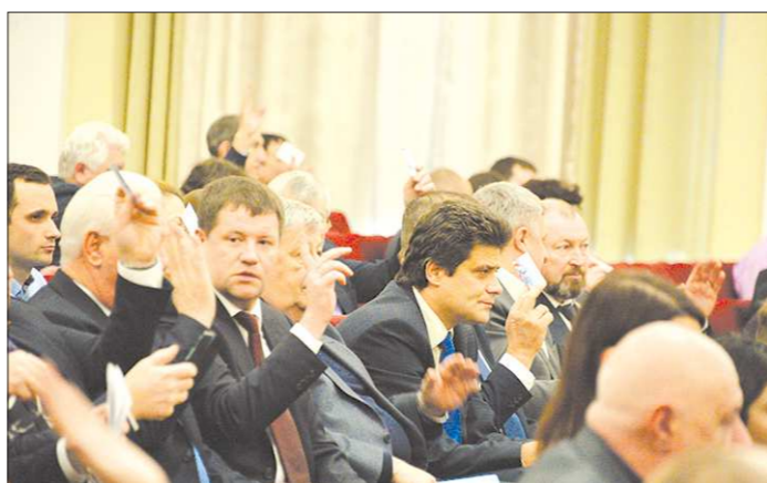
В конференции приняли участие более 240 делегатов и гостей