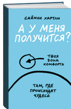
«А У МЕНЯ ПОЛУЧИТСЯ?» Саймон Хартли

Главный герой книги герцог Альберт Йоркский с детства страдает заиканием: каждое публичное выступление для него – настоящая пытка. Молодой человек пытается бороться с недостатком при помощи специалистов, но безуспешно. В итоге он обращается к Лайонелу Логу , логопеду-самоучке, из Австралии. В 1936 году после отречения брата от престола, Альберт вопреки желанию вынужден взойти на трон. Благодаря помощи наставника и упорству Генрих VI становится блестящим оратором и символом Британии в борьбе с немецким фашизмом. История, к слову, написана внуком логопеда Марком Логом .