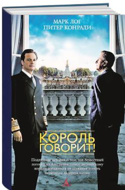
«КОРОЛЬ ГОВОРИТ» Марк Лог, Питер Конради

Книги – отличный источник мотивации. «СверхНовая Эра» подготовила для вас подборку, которая вдохновит на свершения и поможет приятно провести зимний вечер.