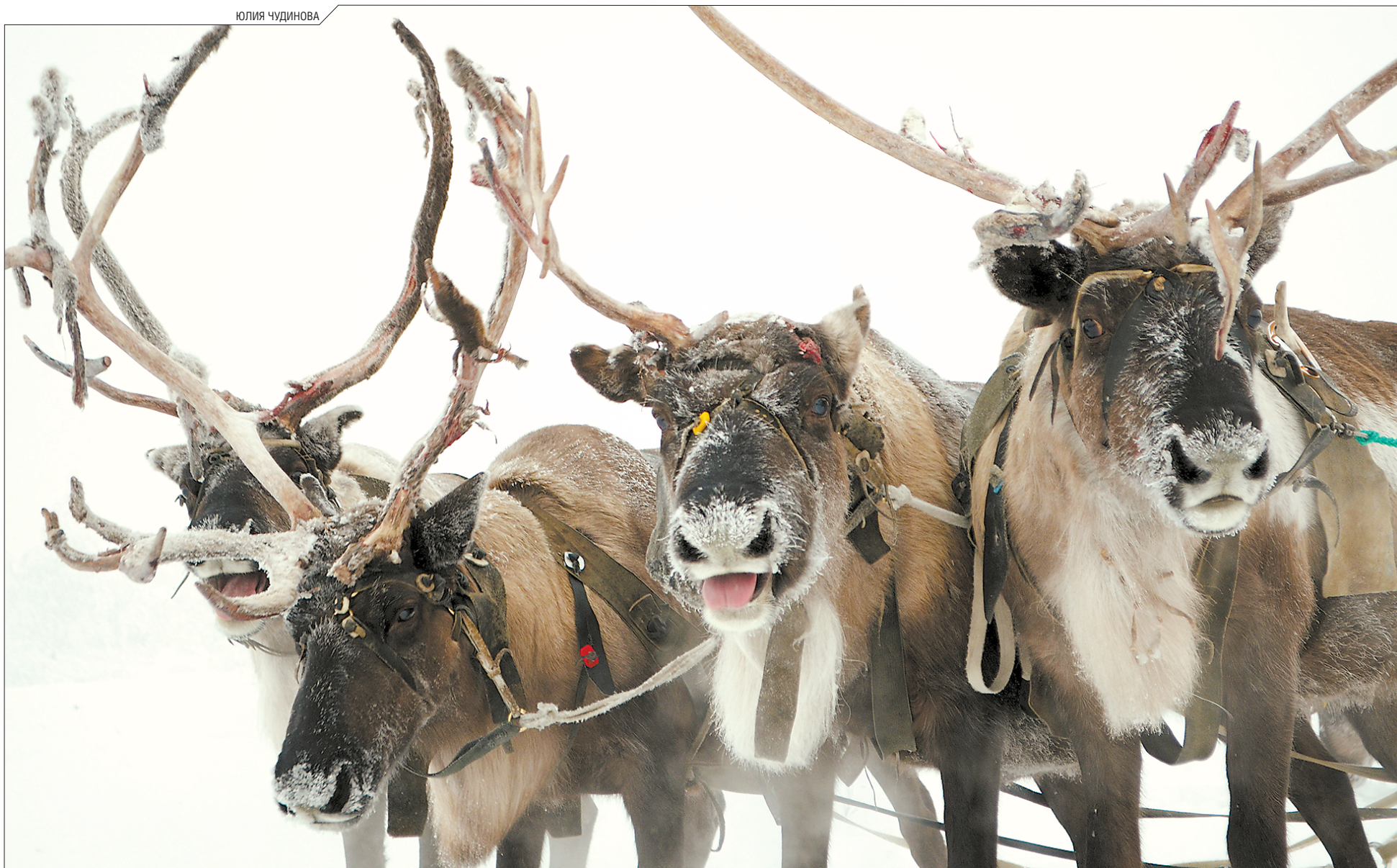
В городе, где нет пастбищ, северных оленей увидеть не так-то просто