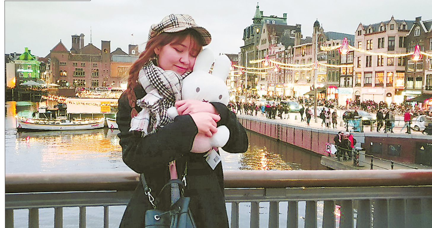
В будущем Эстер мечтает вернуться в родную Корею и стать дизайнером