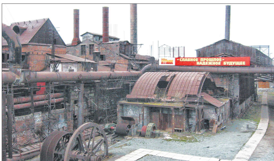
Нижний Тагил. Демидовское наследие: сохраним и приумножим

Добыча уральского золота составляла свыше 500 пудов в год