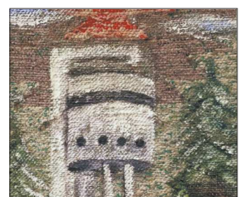
Один из символов Уралмаша – легендарная Белая башня

Вчера в Музее истории Екатеринбурга представили книгу «Уралмаш: улицы, истории, лица». Первую из серии изданий о районах города, которую в музее планируют завершить к 300-летию Екатеринбурга.