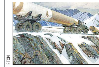
На выставке представлено более пятидесяти произведений живописи и графики ведущих уральских художников из собрания галереи, выполненных в таком особенном для русской живописи школы жанре, как «индустриальный пейзаж».

Адрес: Екатеринбургская галерея современного искусства (ул. Красноармейская, 32). Открыта до 6 февраля.