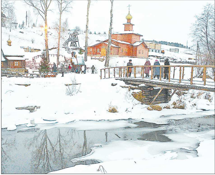
Так выглядит Боголюбский женский монастырь сегодня. В ближайшие годы в обители возведут ещё два храма и построят гостевой дом для паломников