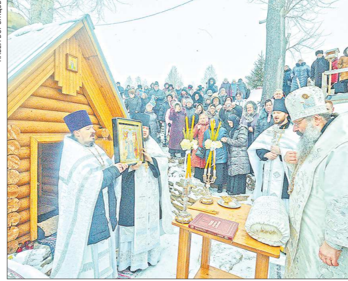
Митрополит Кирилл совершил великое освящение Боголюбского источника при монастыре. За святой водой в обитель приехали более тысячи паломников