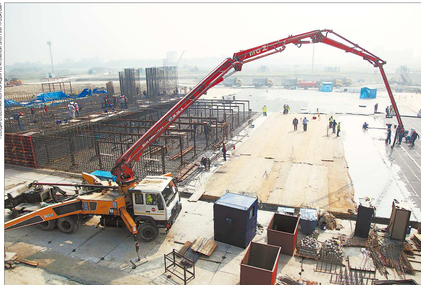
На АЭС «Руппур» будут построены два энергоблока с водо-водяными корпусными энергетическими ядерными реакторами

Свердловское предприятие поставит оборудование для АЭС «Руппур», где создадут тысячи рабочих мест