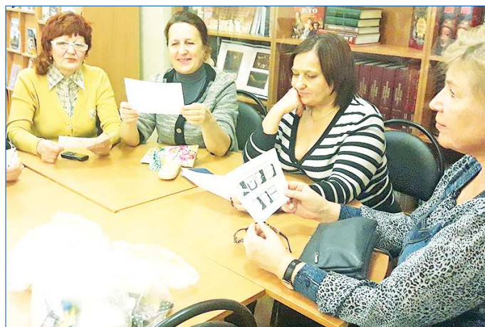
Пенсионеры выдают памятку с упражнениями для лечения храпа

На днях в библиотеке № 14 Екатеринбурга состоялась очередная встреча пенсионеров в «Школе пожилого возраста». Темой первой в Новом году встречи стало обсуждение насущной для старшего поколения проблемы – храпа.