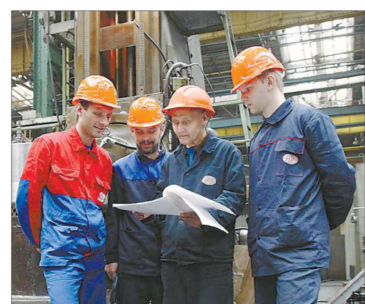
Получить новую профессию в Производственном инкубаторе Уралмашзавода можно за полгода

«Мы провели большую аналитическую работу и выяснили, что зачастую студенты 3-х и 4-х курсов технических вузов и колледжей уже знают, на каком предприятии будут проходить