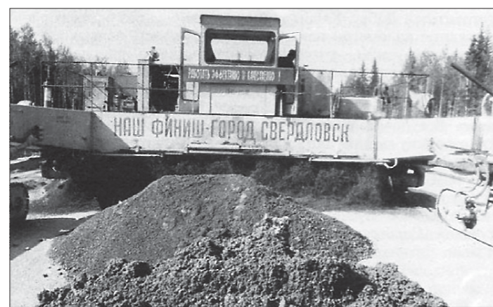
Свердловскавтодор во время строительства дороги применил прогрессивную по тем временам систему – комплекс «Автогрейд»