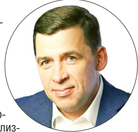
ДЕПАРТАМЕНТ ИНФОРМАТИКИ СО

Его отмечают мужественные, сильные и благородные люди, посвятившие свою жизнь спасению людей, всегда готовые прийти на помощь оказавшимся в беде. Ваша работа требует высочайшего профессионализма и оперативности, богатых знаний и опыта, самоотверженности и способности идти на риск. Какие бы катаклизмы ни происходили: наводнения и пожары, техногенные аварии и катастрофы, - уральцы всегда находятся под вашей надёжной защитой.