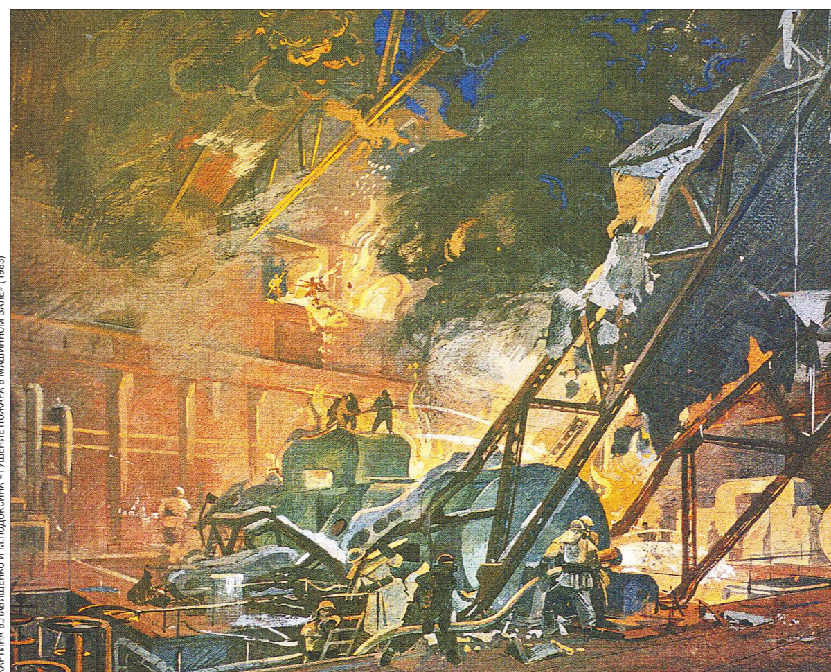
КАРТИНА ВЛАДИСЛАВА П. ПОДКОСОВА «ТУШЕНИЕ ПОЖАРА В МАШИНОМ ЗАЛЕ» (1983)

Когда кто-то (особенно иностранец) говорит об «ужасной русской зиме», то обычно имеет в виду холод. Даже выражение есть - «Жуткий холод». Однако иногда зима бывает адски жаркой - и это гораздо хуже, чем жуткий холод.