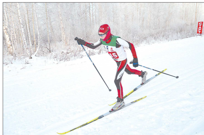
Трасса на лыжной базе «Масляны» в посёлке Октябрьский проложена в живописной берёзовой роще