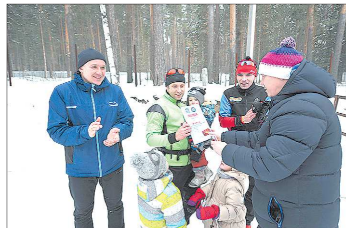
У одного из победителей нашей гонки в Берёзовском было сразу трое юных болельщиков