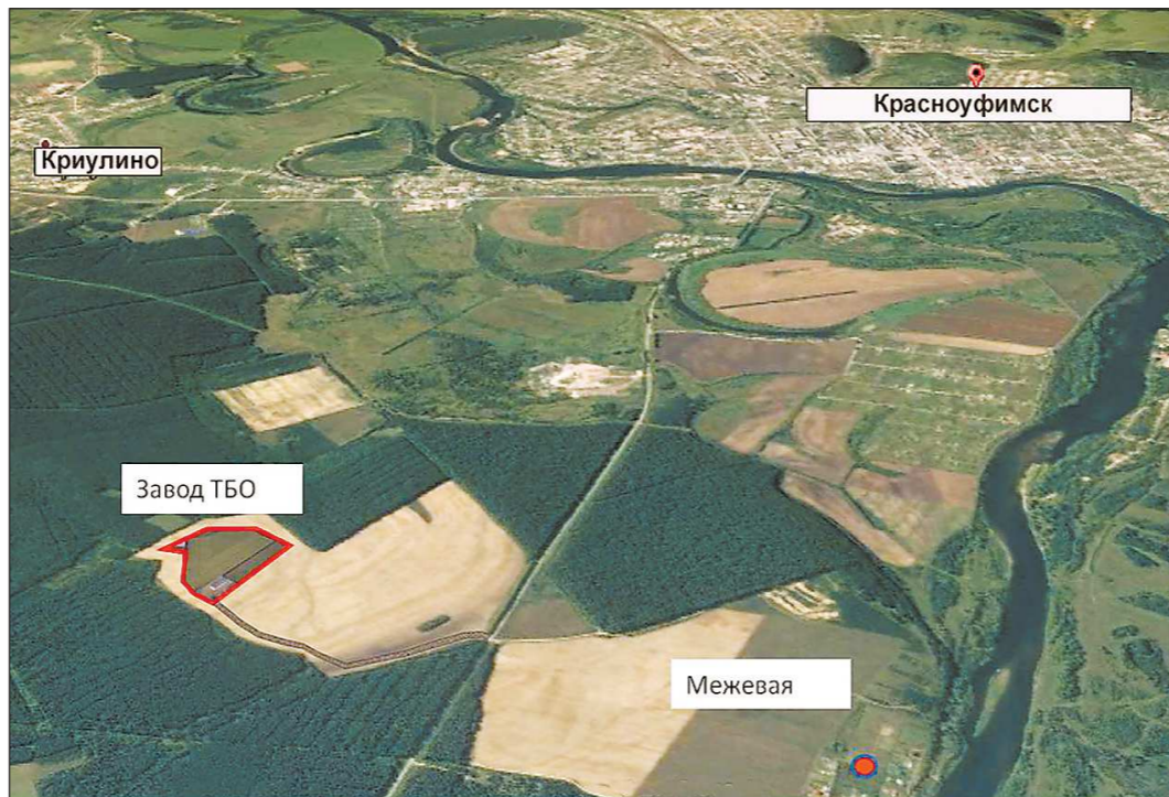
Жители считают, что новый комплекс построят слишком близко к жилой зоне. В ответ региональный оператор показал карту с реальными расстоянием

шания по проекту. Земельный участок под новый комплекс уже выделен, но он категорически не устраивает жителей. — Очень близко к населённым пунктам: в двух километрах — село Крылово и деревня Межевая, в трёх километрах — город и река Уфа, а в километре — детский лагерь «Чайка».