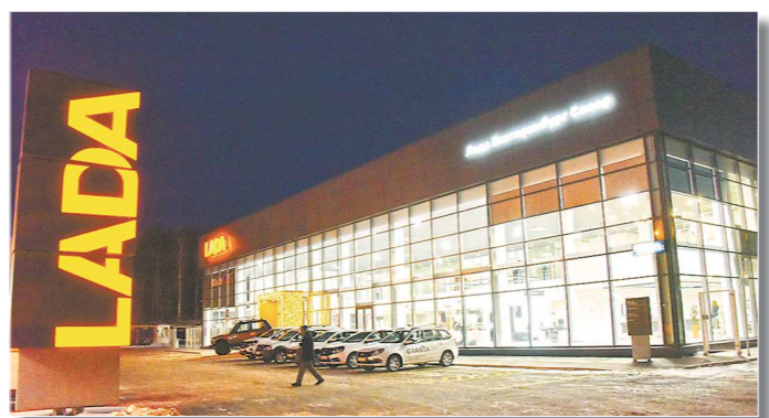
Новый дилерский центр Лада Екатеринбург Север — буквально дворец

Открылся новый дилерский центр АВТОВАЗа в столице Среднего Урала — на улице Шефской, 116 а.