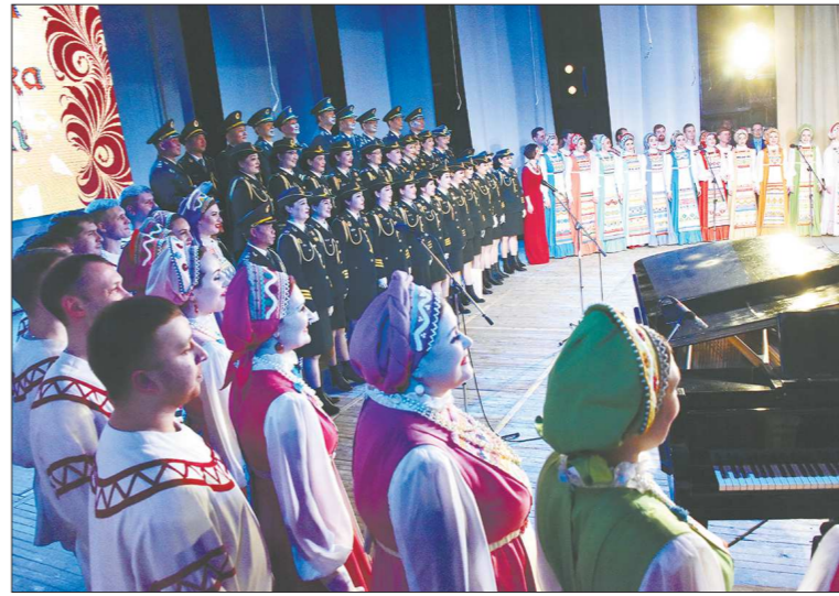
В финале концерта песня прозвучала уже в исполнении двух хоров – уральского и китайского