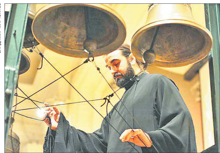
В начале торжественной церемонии со сцены филармонии возвестили церковные колокола