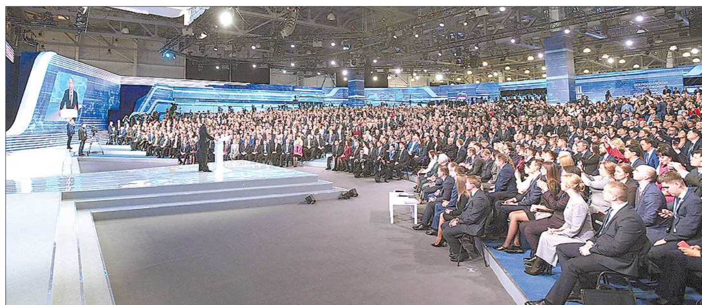
В работе съезда приняли участие около 3,5 тысячи делегатов и гостей

«Хамство вредно для страны» Ещё одна резонансная инициатива – создание кодекса этических норм, который должны соблюдать все партийцы. В числе таковых – уважение и внимание к проблемам людей, нетерпимость к попыткам пересмотра и искажения российской истории, выполнение своих обязательств и уход в отставку со всех партийных должностей в случае, если партийцу предъявлены обвинения в совершении преступлений и проступков, которые соответствуют действительности. Комментируя инициативу, секретарь генсовета «Единой России» Андрей Турчак отметил, что в последнее время в разных территориях проявляются неосторожные высказывания политиков». А для соблю-