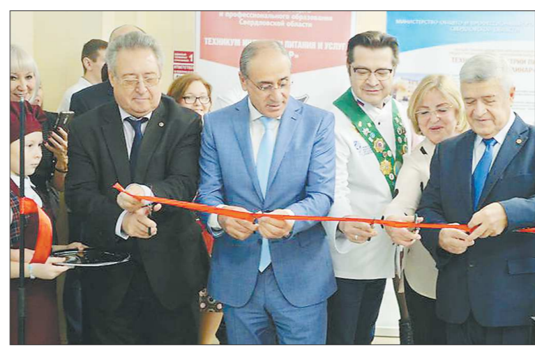
С этого момента начался новый виток в истории техникума «Кулинар»

По предварительной оценке, резиденты кластера планируют реализовать инвестиции в объёме 8 миллиардов рублей и создать в предстоящие 10 лет порядка 2,5 тысячи рабочих мест. Законопроект по налогу на имущество, помимо предпочтений для инвесторов туристического кластера, предусма-