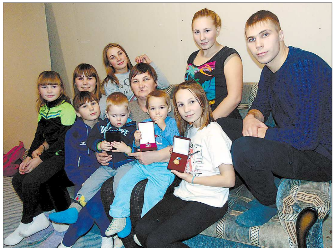
На момент визита корреспондента «Областной» почти вся семья была в сборе. Новый год и новоселье семья будет отмечать в полном составе

Село Лая. Огромный дом на улице Краснознамённой пока выглядит полуфабрикатом. Жильями в нём стали лишь спальни да кухня, в остальных комнатах нет ни обоев, ни мебели.