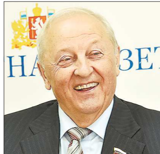
Первый глава администрации, первый председатель Областной думы и первый губернатор Свердловской области Эдуард Россель сегодня представляет Средний Урал в Совете Федерации России

возглавлявший этот орган с декабря 2009 по март 2012 года Вячеслав Лашманкин, как считается, сыграл активную роль в проведённой при губернаторе Александре Мишарине реформе законодательной власти региона. Поговаривают, правда, о влиянии на Лашманкина тогдашнего руководителя аппарата администрации Екатеринбургского Владимира Тунгусова, впоследствии (в 2016 году) возглавившего администрацию губерна-